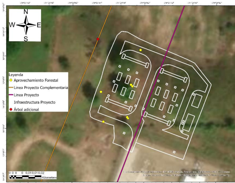
Ilustración 4. Localización de los individuos del inventario forestal verificados en campo.

Sin embargo, se verificó en campo la ubicación de los individuos arbóreos evidenciando que la empresa TRANSELCA S.A. E.S.P., además de los individuos reportados en el inventario forestal requiere intervenir 1 individuo que se encuentra localizado bajo las coordenadas 10°39'10" N y 74°54'44" W. De igual forma, el individuo inventariado con ID C48 bajo coordenadas (10°39'8.125" N y 74°54'41.123" W) no será aprovechado según lo comunicado bajo visita técnica.