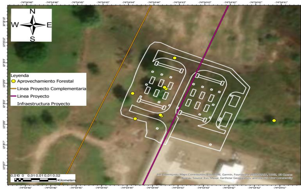
Ilustración 3. Localización de los individuos del inventario forestal de la solicitud de aprovechamiento.

Sin embargo, se verificó en campo la ubicación de los individuos arbóreos evidenciando que la empresa TRANSELCA S.A. E.S.P., además de los individuos reportados en el inventario forestal requiere intervenir 1 individuo que se encuentra localizado bajo las coordenadas 10°39'10" N y 74°54'44" W. De igual forma, el individuo inventariado con ID C48 bajo coordenadas (10°39'8.125" N y 74°54'41.123" W) no será aprovechado según lo comunicado bajo visita técnica.